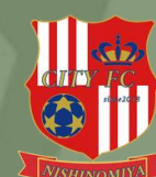
西宮シティ FC HYOGO