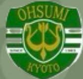
大住 SSS KYOTO