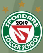
SFONDARE SS NARA