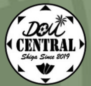
DCM セントラルシガ SHIGA